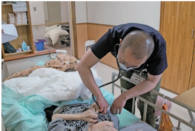
聴診器で胸の音を聴きます

「患者さんからしてみると、体力のことも心配なので通院の負担が減って、尚且つ知らない場所に行くストレスも減るのでとてもメリットがあると思います。あと先生が診察に来ることでスタッフも安心ができますね。障がいのある方は、環境が変わることに対応が難しい方も多いため、病院に入院するよりも、慣れた施設で過ごすことの方がいいと思います。ただ、〇〇さんは、病院を退院される日に、ここ(病院)に居たいと、おっしゃっていました。施設のスタッフとしては、ちょっと複雑な心境ですが…。」