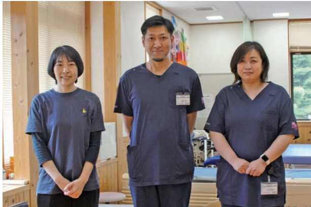
リハビリテーションスタッフ