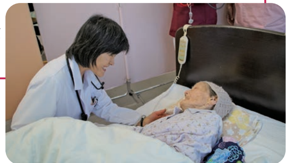
施設回診のイメージ