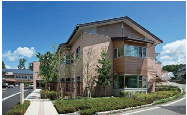
ひめばら 地域交流スペース

〒391-0108 長野県諏訪郡原村13221-6 (中新田診療所隣接) 電話:0266-70-1305