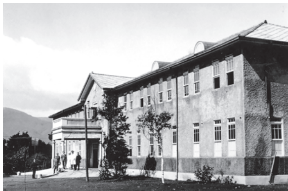
創立当時の正面玄関