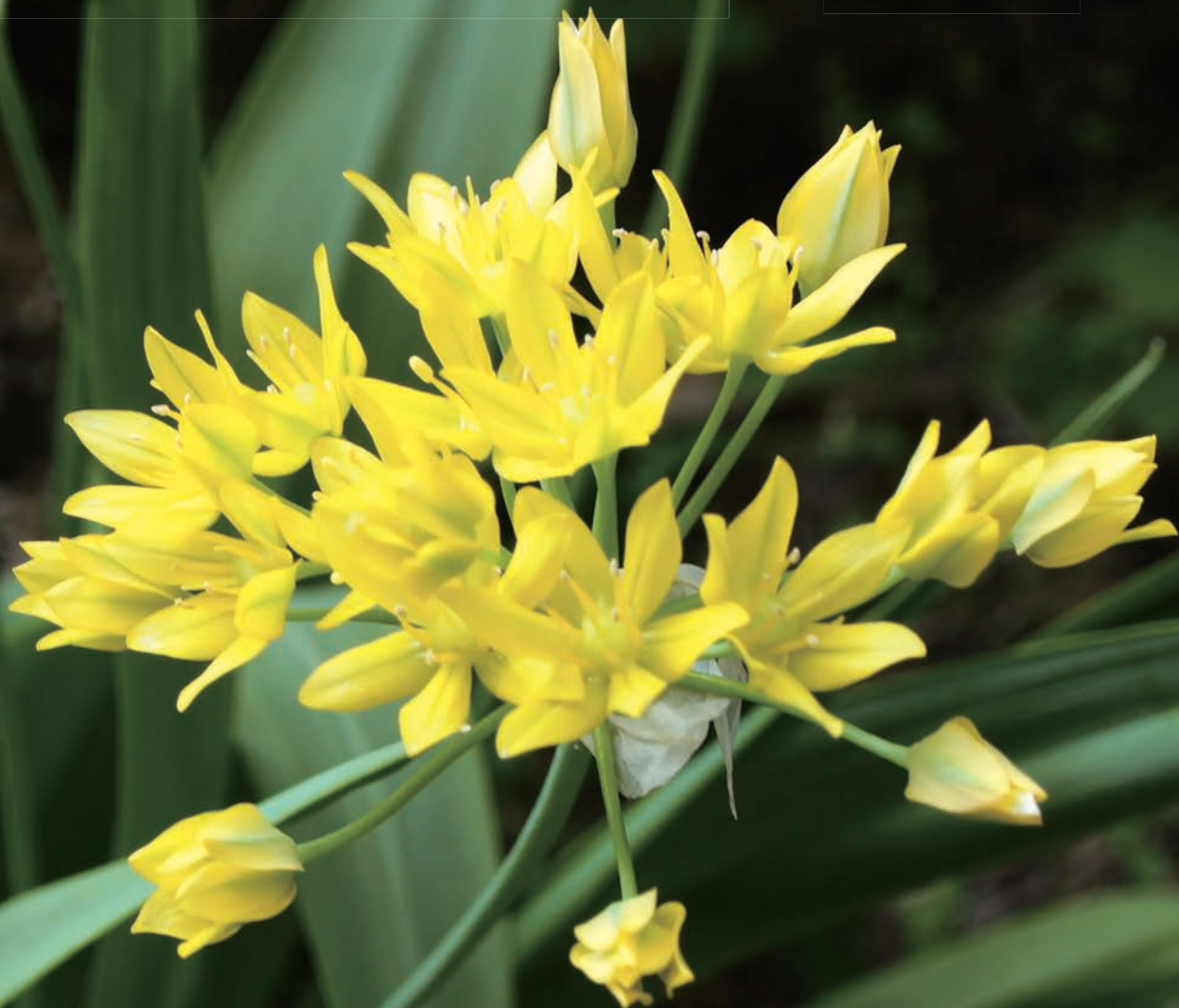
アリウム・モーリー〈黄花行者大蒜〉(職員玄関前)