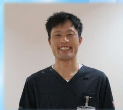
リハビリテーション部