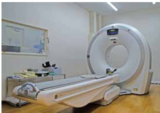
CT検査機器 (2021年リニューアル) 画像処理装置 (2024年リニューアル)