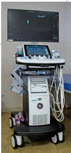
超音波検査機器 心臓の超音波検査も 行っています