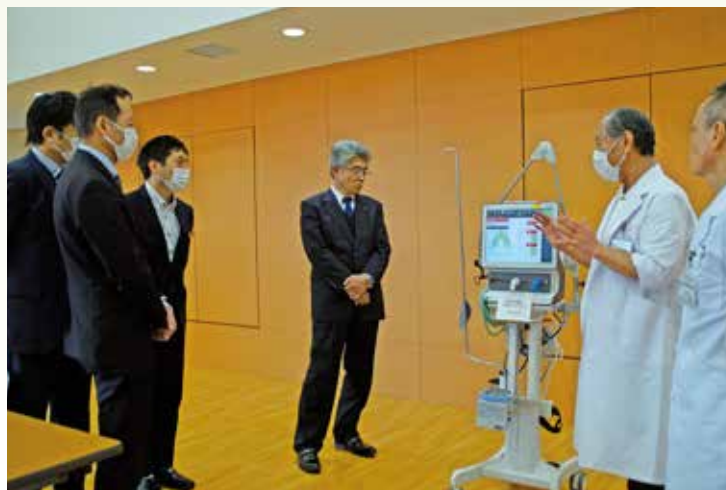
JA共済の皆様へ臨床工学科技師長が機器の説明をしました。 (向かって右から2人目)