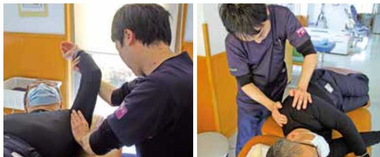
肩のリハビリテーション 肩の専門医の指示のもと積極的に行っています