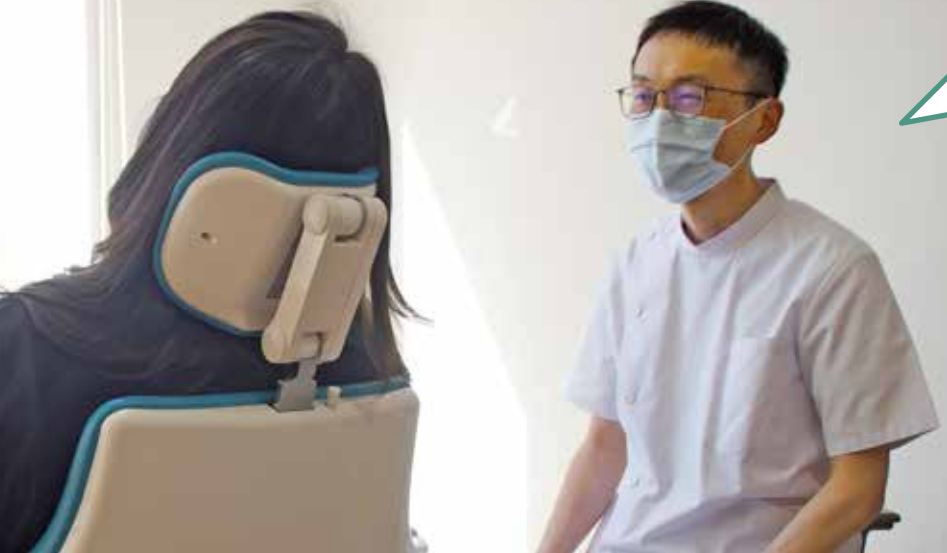
●歯科口腔外科医長