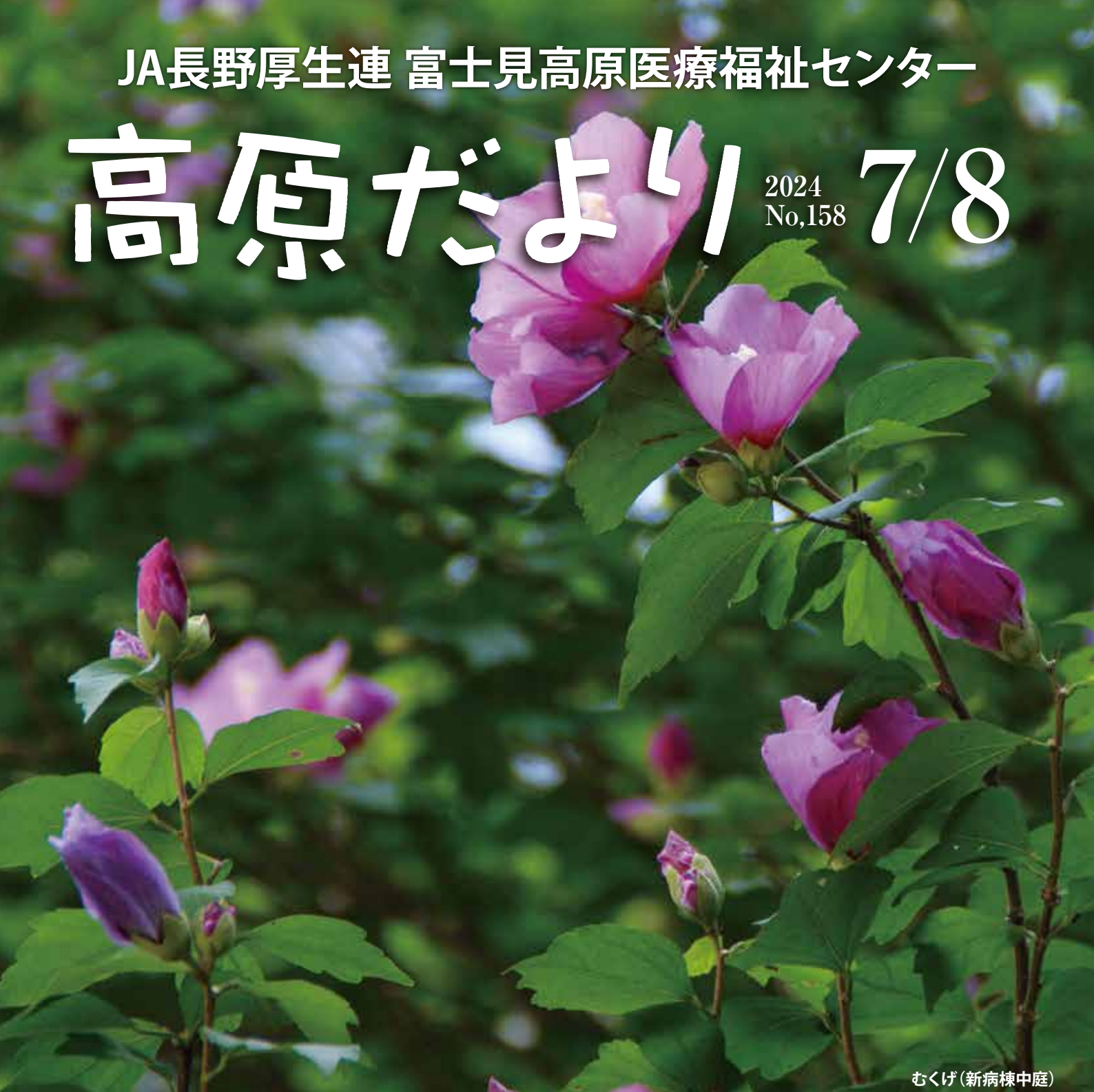
むくげ (新病棟中庭)

朝の内に、慣れない道具を手に先日の強風で倒れかかった樹の片付けに向かう。湿気が少ない高原とはいえ、最近では昼も過ぎると下界並みに暑くなる。それまでの究極のアナログ作業だ。このところ、電子カルテにスマートフォン