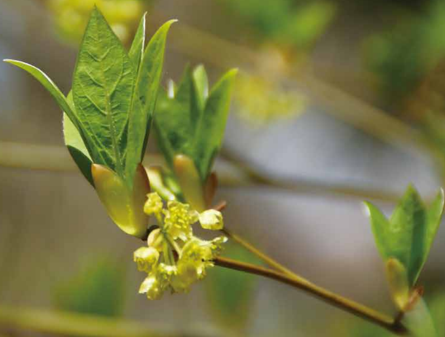
くろもじ(病院中庭)

最近の気温変化は乱高下が激しくて季節が全く読めないが、昼間の時間だけは確実に延びてきている。柔らかな春の陽ざしの中で手足や背筋を伸ばし、冬の間に重くなったり硬くなったりした体をほぐして野外での運動や作業を始める時期だ。花粉は厄介者だが、小鳥のさえずりを聞きながら春風を思いっきり吸い込めば、冷え切っていた気分も晴ればれて免疫力も上がる。まだ、高原では花の便りは聴かれないが、冬の冷気に凍えていた樹木の枝には芽吹き