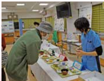
フレイル予防栄養相談

具合が悪い時に来院する 病院とは違い、多くの方が笑顔で楽しい 体験をしていただけたと思います。 地域の小中学生や団体のステージ発表があり、 幅広い世代の方に、病院を身近に 感じていただける機会になりました。