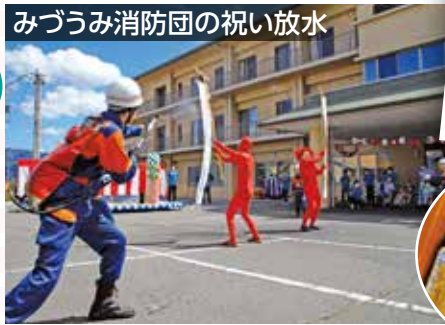
みづうみ消防団の祝い放水