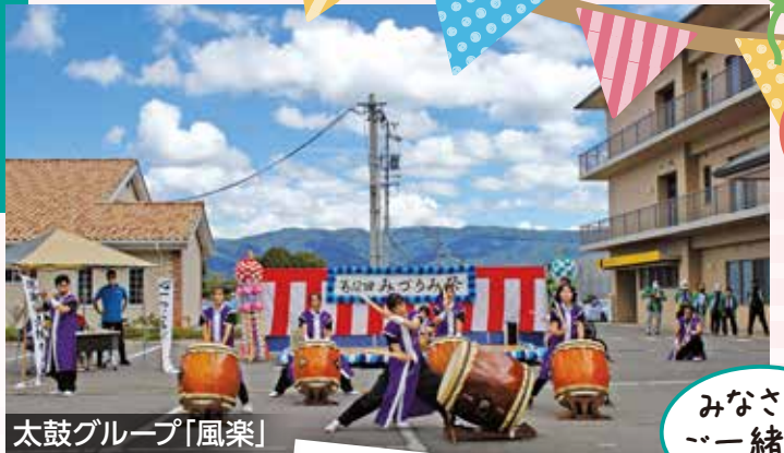
太鼓グループ「風楽」