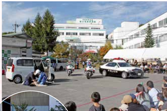
バイスタンダーによる 救助活動

具合が悪い時に来院する 病院とは違い、多くの方が笑顔で楽しい 体験をしていただけたと思います。 地域の小中学生や団体のステージ発表があり、 幅広い世代の方に、病院を身近に 感じていただける機会になりました。