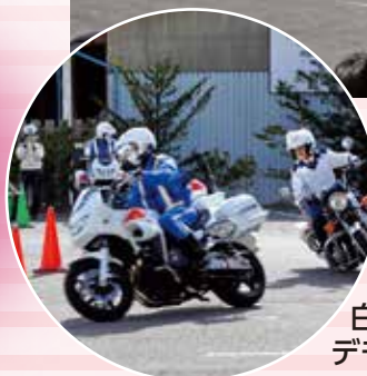
白バイ隊員による デモ走行