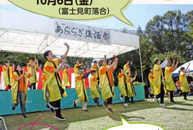
あらかぎ名物 ダンスチーム