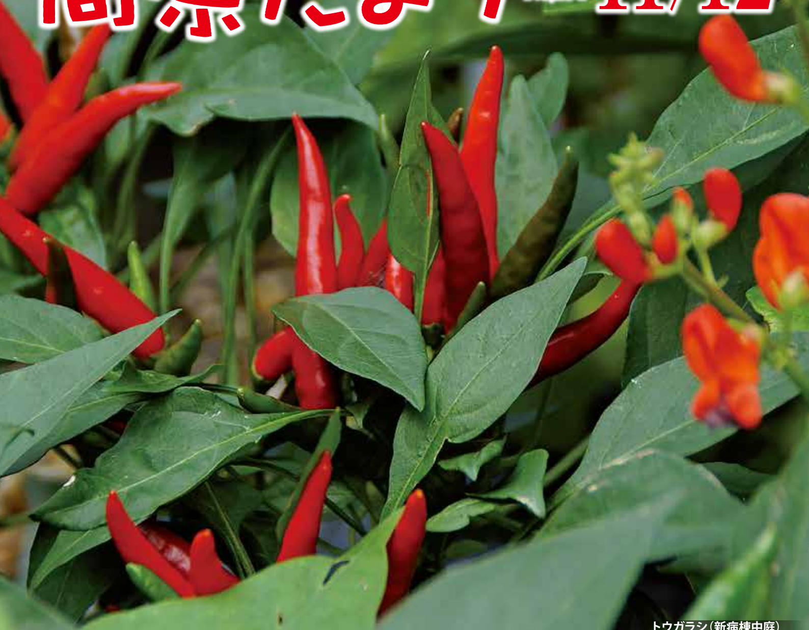
トウガラシ(新病棟中庭)

八ヶ岳山麓の高原では朝晩の冷え込みが日に日に厳しくなってきた。これからが日中のキリッと澄んだ空気と、帰宅後に迎えてくれる薪ストーブの季節だ。今年、我が家で20年ぶりに新調した岐阜県メーカーの一品は、無骨な外見だが燃焼効率は優れもので煙も灰もわずかしか出ない。時間に追い立てまかれるせわしなさを忘れて、ガラス窓越しにゆらゆらと立ち上がるオレンジ色の炎に見とれているうちに、身も心も芯から暖まってくる。