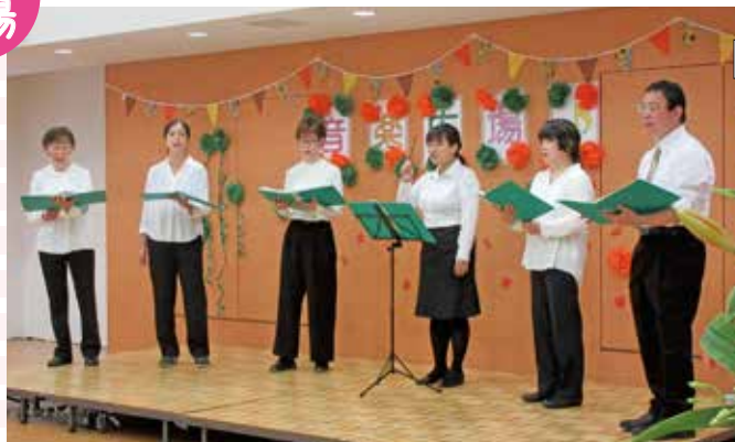
「我らの高原病院」(作詞・作曲 整形外科 安田岳)を 会場のみなさまと一緒に歌いました