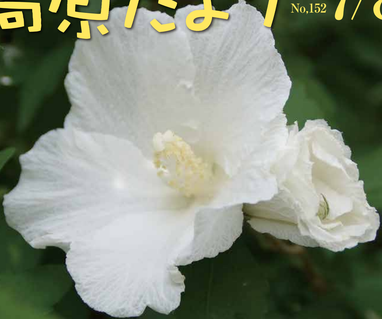
むくげ (新病棟中庭)