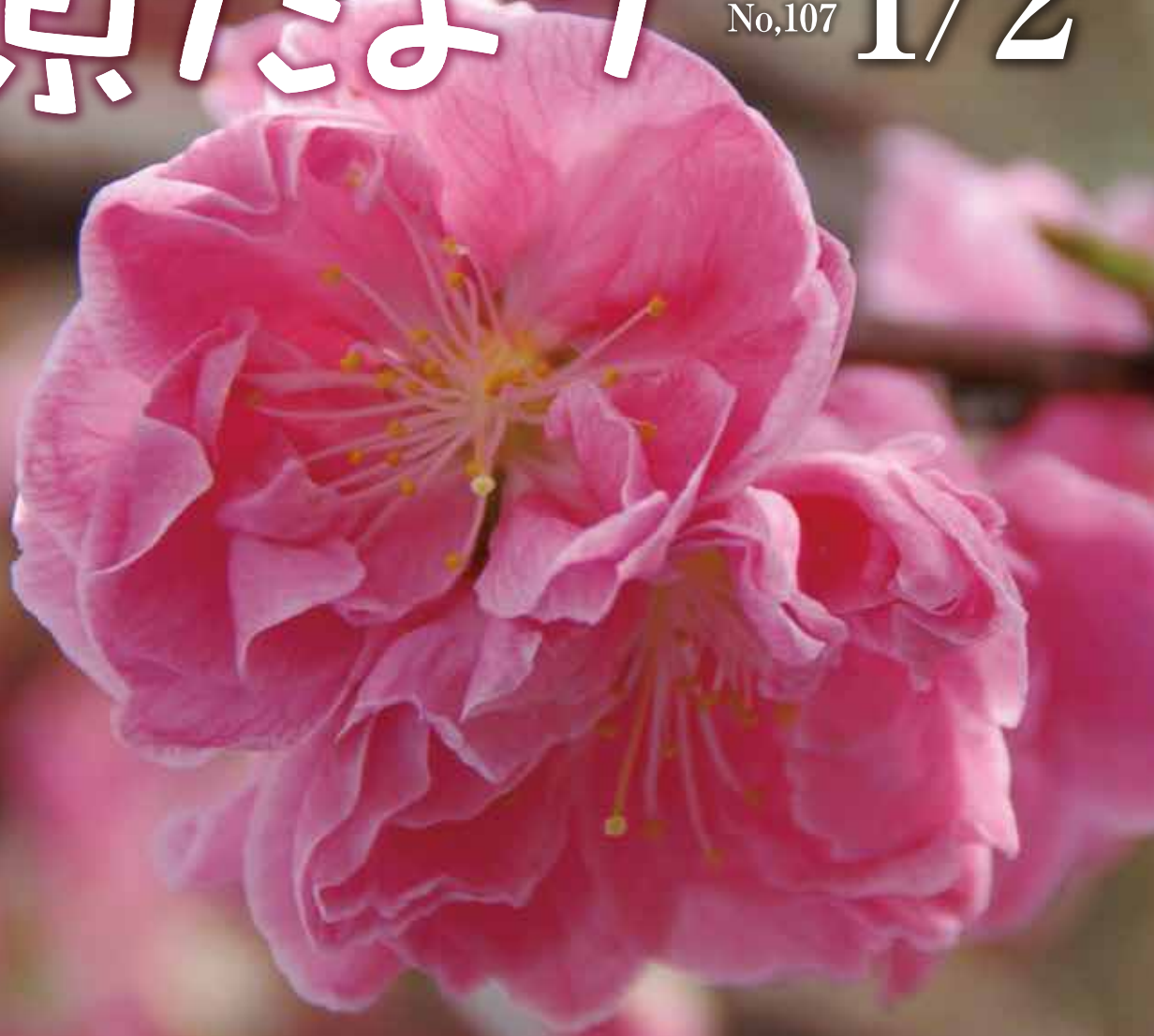
八重寒梅 (病院正面玄関)