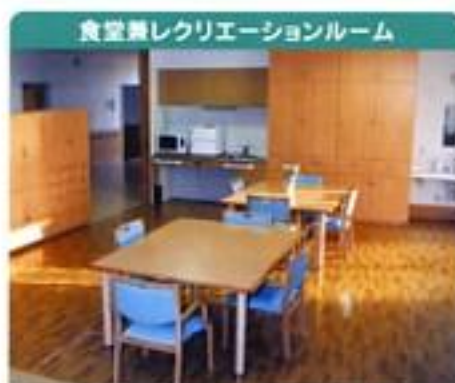
食堂兼レクリエーションルーム